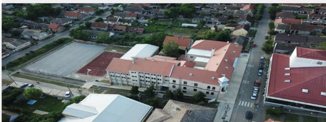
Сл 1. Основна школа „Доситеј Обрадовић“ Ириг