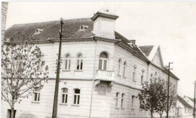
Сл 1. Основна школа „ Доситеј Обрадовић“ Ириг 1970